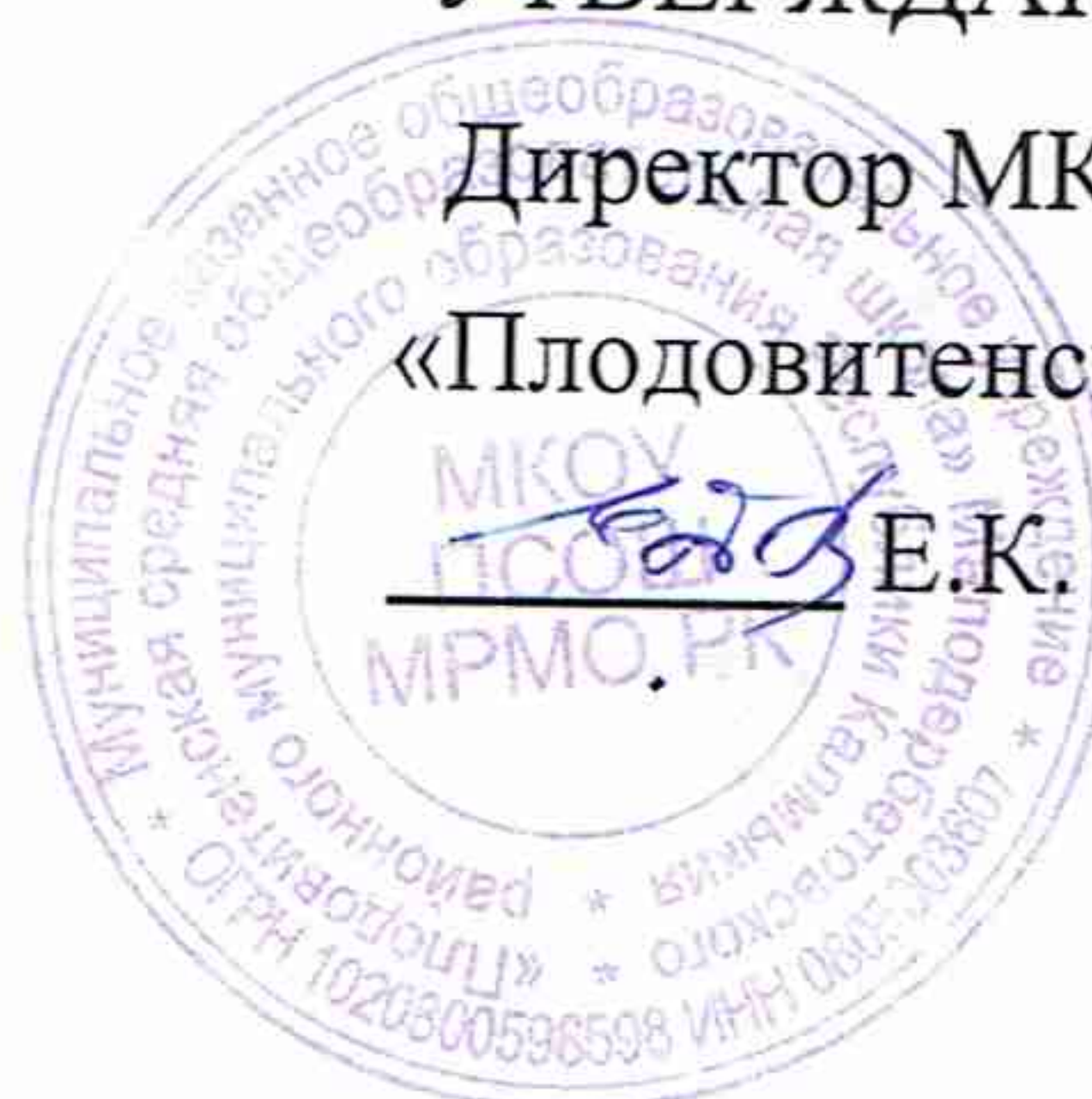
График оценочных процедур в 1–9-х классах на 2024-2025 учебный год МКОУ «Плодовитенская СОШ»

На основании письма Минпросвещения РФ от 06.08.2021 г. № СК-228/03 и письма Рособнадзора от 06.08.2021 г. № 01-169/08-01 «Рекомендации для системы общего образования по основным подходам к формированию графика проведения оценочных процедур в общеобразовательных организациях в 2023-2024 учебном году» В МКОУ «Плодовитенская СОШ» разработан настоящий график. В основе графика лежат данные Рабочих программ по предметам.